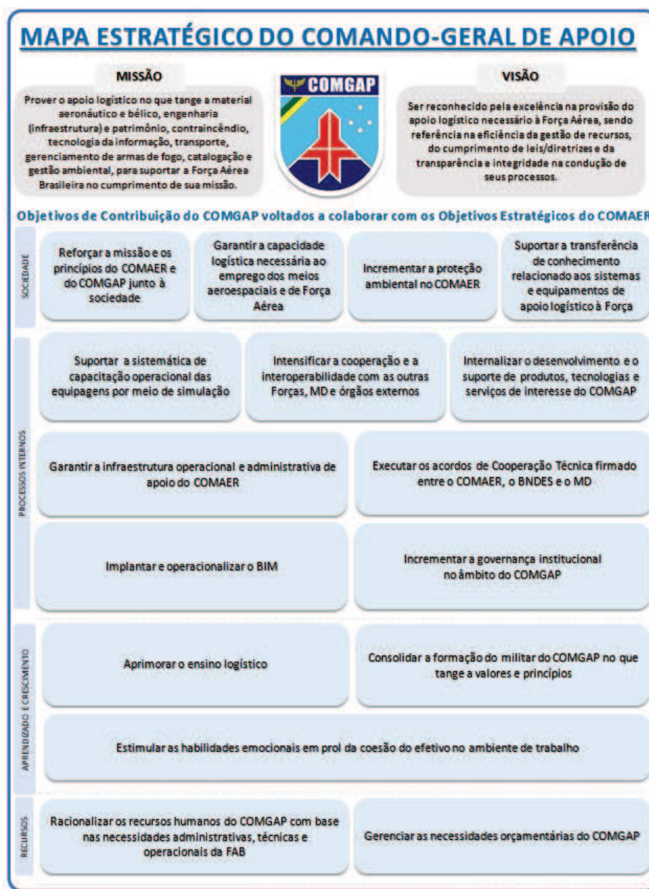
Figura 2 – Mapa Estratégico do COMGAP

Art. 18. As diretrizes emanadas do Comandante da Aeronáutica (CMTAER) estão contidas na Diretriz de Comando do Comandante da Aeronáutica, disponível no sítio eletrônico https://issuu.com/portalfab/docs/diretrizes_do_comandante_-_2023_ten_brig_damasceno .