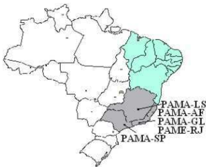
Figura 2 - Distribuição geográfica dos Laboratórios Regionais de Calibração do SISMETRA.

A Região Sudeste do País conta com cinco Laboratórios Regionais de Calibração do SISMETRA (LRC-SP, LRC-LS, LRC-AF, LRC-GL e LRC-PAME-RJ), com três destes laboratórios localizados na região metropolitana do Rio de Janeiro. Desta forma, mesmo se considerarmos a desativação já programada do NuPAMA-AF e consequente extinção do LRC-AF, ainda assim, a referida região permaneceria com um significativo apoio metrológico, capaz de atender, de forma satisfatória, às necessidades de calibração das OM sediadas. A figura 2 ilustra a distribuição geográfica em território nacional dos Laboratórios Regionais de Calibração do Sistema de Metrologia Aeroespacial.