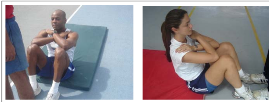
Figura 3 – Flexão de tronco sobre as coxas para os sexos masculino e feminino

Neste exercício serão exigidos os mesmos padrões de execução para ambos os sexos.