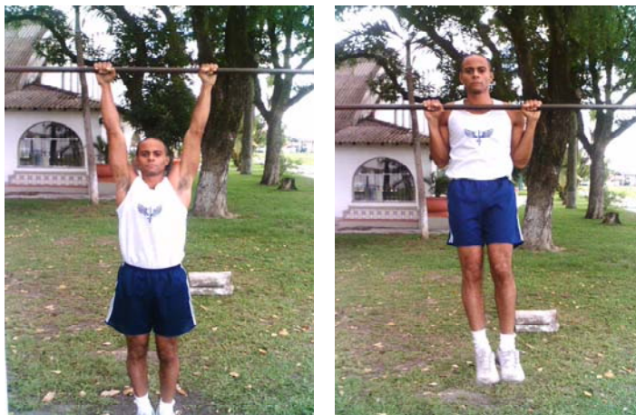
Figura 1 – flexão na barra fixa para o sexo masculino