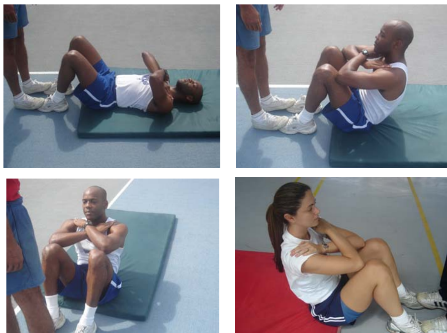
Figura 3 – flexão de tronco sobre as coxas para os sexos masculino e feminino

Obs.: Neste exercício serão exigidos os mesmos padrões de execução para ambos os sexos.