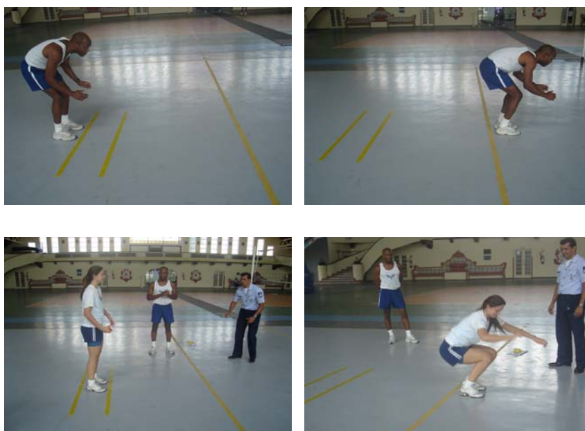
Figura 5 – salto horizontal para os sexos masculino e feminino