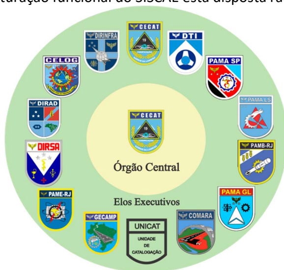
Figura 1 – Estrutura Funcional do SISCAE

Art. 15 A estruturação funcional do SISCAE está disposta radialmente, conforme a Figura 1: