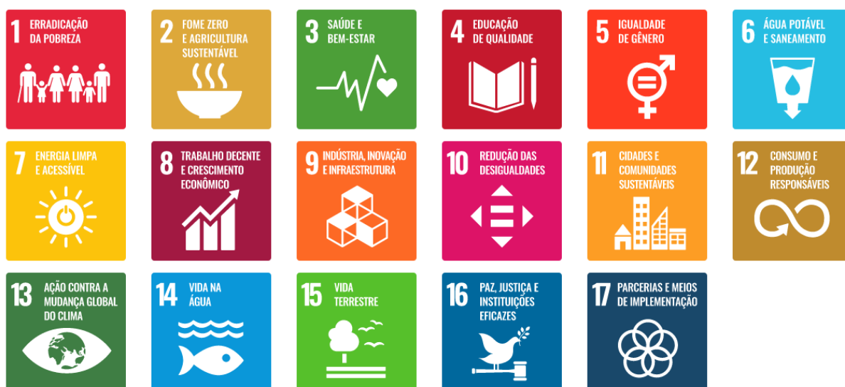
Figura 5 – Objetivos do Desenvolvimento Sustentável

Art. 142 Atualmente, os museus têm buscado alinhar suas práticas aos Objetivos do Desenvolvimento Sustentável (ODS), lançados pela Organização das Nações Unidas (ONU), que consistem em “um apelo global à ação para acabar com a pobreza, proteger o meio ambiente e o clima e garantir que as pessoas, em todos os lugares, possam desfrutar de paz e de prosperidade” (ONU, 2014) 5 .