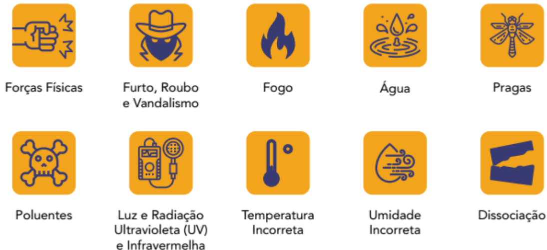
Figura 4 – Agentes de risco

Risco é a probabilidade de algo acontecer causando diversas gradações de perigos ou efeitos negativos. O risco em museus é a chance de que algo aconteça causando danos e perda de valor para acervos musealizados, por meio da ação de um ou mais agentes de risco. Estes estão ligados a fatores relacionados ao edifício, ao território (características geográficas e/ou climáticas) e também a fatores socioculturais, políticos e econômicos de uma determinada região (IBRAM, 2017) 4 .